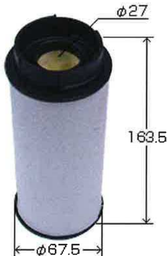
略 図 Brief Drawing

備考：純正部品販売価格 ¥ 4,800.- JAN:4971295333806 ITF:14971295333803