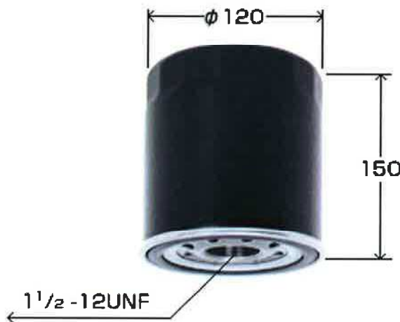
略 図 Brief Drawing

備考：純正部品販売価格 ¥ 4,660.- JAN:4971295153206 ITF:14971295153203